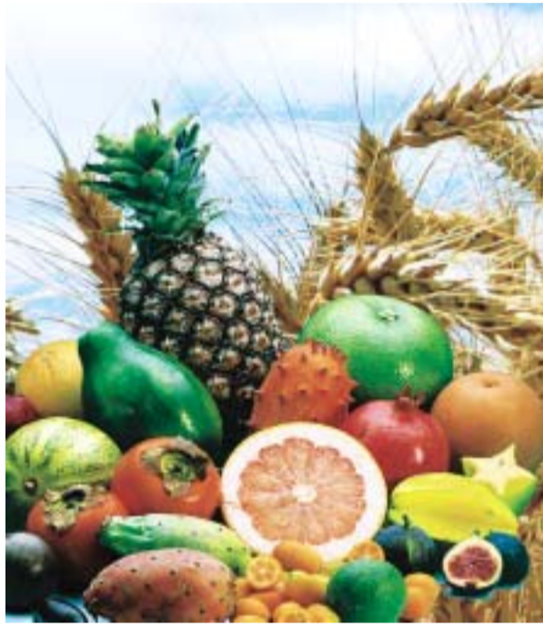
Getreide und Obst haben besonders viele Ballaststoffe.

(dgk) Wer ballaststoffreich isst, lebt länger. Dies ergab eine Studie US-amerikanischer Krebsforschungs- und Gesundheitsinstitute, bei der neun Jahre lang fast 400.000 Teilnehmer beobachtet wurden. Das Fünftel der Teilnehmer, das die meisten Ballaststoffe zu sich nahm, hatte eine um 22 Prozent verminderte Sterblichkeit. Bei den Herz-Kreislauf-Erkrankungen und sogar bei Infektions- und Atemwegserkrankungen gab es in dieser Gruppe deutlich weniger Todesfälle.