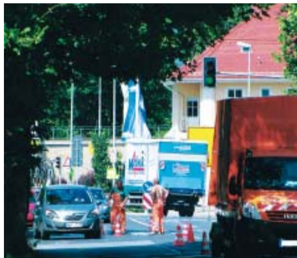
Alte Platanen an der Maxim-Gorki-Straße sind eine Unfallquelle. Auf dem Foto sind die Markierungsarbeiten für eine Einsparigkeit zu sehen.

Pirna. Seit Mittwoch vergangener Woche steht auf der Maxim-Gorki-Straße in Richtung Bundesstraße 172 im Bereich der Platanen nur noch eine Fahrspur zur Verfügung. Die Haftpflichtversicherung der Stadt Pirna hat auf einen möglichen Unfallschwerpunkt durch die in die Fahrbahn hineingewachsenen Bäume hingewiesen, teilt die Pirnaer Stadtverwaltung mit. Eine verkehrsrechtliche Prüfung habe ergeben, dass