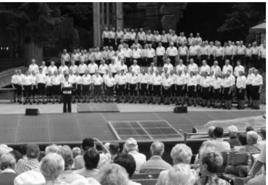
Der Bergsteigerchor bei seinem Auftritt auf der Felsenbühne Rathen.

Kurort Rathen. Dass die Besucher der Felsenbühne Rathen ihre Regenschirme aufspannen, kommt öfter mal vor. Doch dass die Schirme nicht als Schutz vor dem Regen, sondern vor den Sonnenstrahlen dienen, ist im schattigen Wehlgrund eine Seltenheit. Viele Wanderfreunde, Touristen und Urlauber hatten sich am vorigen Samstag nachmittag bei herrlichem Wetter zur Felsenbühne auf den Weg gemacht, um in dieser einmaligen Naturkulisse das traditionelle Konzert des Sächsischen Bergsteigerchores „Kurt Schlosser“ zu erleben. Nachzügler, die den Weg von der Fähre nicht ganz so schnell schafften, konnten schon von weitem solche bekannten Lieder wie das von den Bergkameraden, „Hoch auf dem gelben Wagen“ oder „Über weiten Bergeshöhen“ hören, die aus 140 kräftigen Männerkehlen erklangen. Aber auch andere beliebte Bergsteiger-, Wander-, Heimat- und Volkslieder sowie klassische und zeitgenössische Werke standen auf dem abwechslungsreichen Programm.