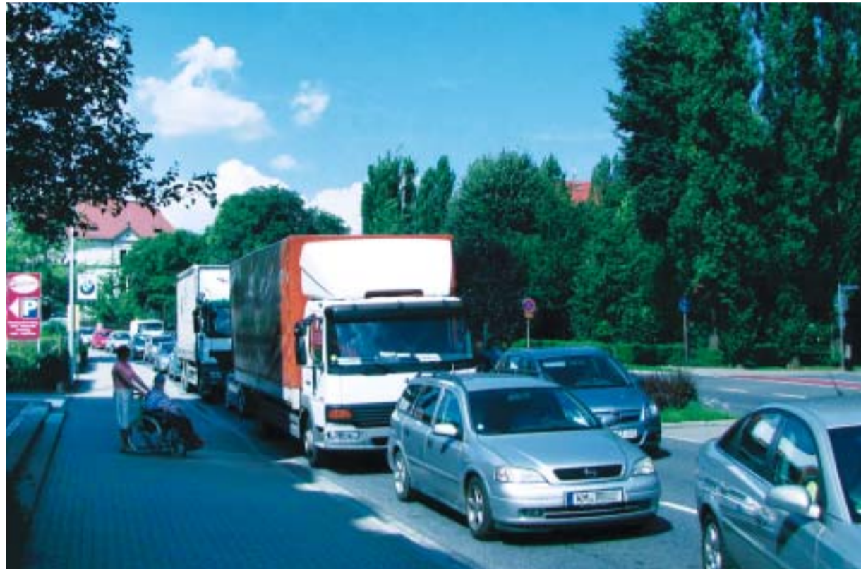
Dicht an dicht drängen sich die Fahrzeuge an der Querung Königsteiner Straße. Die Pirnaer Rundschau begleitete die rüstige Rentnerin und ihren Ausflügler Micha im Rollstuhl zum Problempunkt an der Königsteiner Straße.

Pirna. Die B 172 ist derzeit ein Nadelöhr. Insbesondere aufgrund von Baumaßnahmen auf der Dippoldiswalder Straße und Einsteinstraße kam und kommt es immer wieder zu Rückstau. Doch nicht nur die Autofahrer ärgern sich darüber.