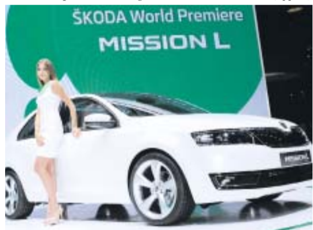
Skodas Kompaktlimousine Mission L. Es ist die sechste Modellreihe der Tschechen.

setzt. Auf scharfe Linien wurde bei der Gestaltung immer wieder zurückgegriffen. An den Flanken des Fahrzeughecks bilden drei von ihnen kurz vor den Rückleuchten ein fein herausgebildetes Dreieck, das an geschliffenes Glas erinnert. Ein schwarz-transparentes Glasdach überspannt das aufge-