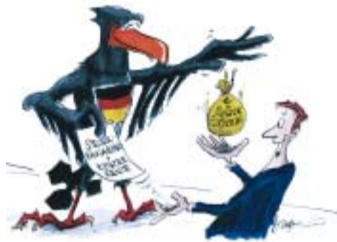
Auch für Riester-Sparer lohnt sich das Ausfüllen der Steuererklärung.