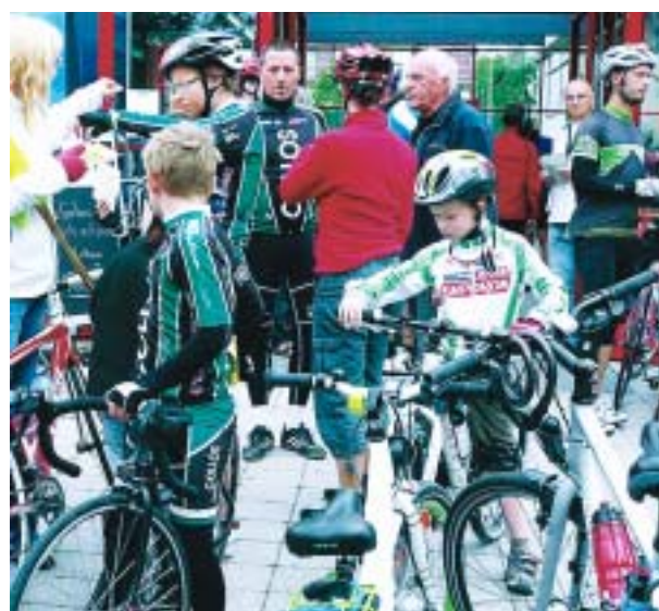
Bei den Startvorbereitungen.

Mit einem Handybike nahm der seit einem Kletterunfall gehandicapte Sportler die 150 Kilometer lange Strecke auf sich. Mit 39 Radlern schickte der gastgebende Dresdner SC 1898 die meisten Teilnehmer ins Rennen. Am zweitstärksten war die Großsedlitzer Heinrich-Heine-Grundschule mit 18 Teilnehmern vertreten. Anlässlich des 30-jährigen