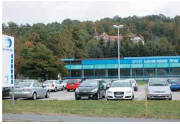
Die Schwimmhalle soll neu gebaut werden.

Neue Schwimmhalle und neue Sporthalle für Schillergymnasium geplant